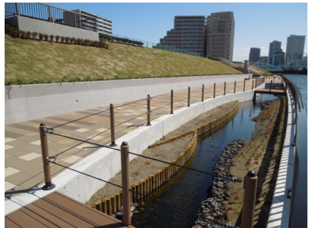
<新・開放された堤防西側の入り江>